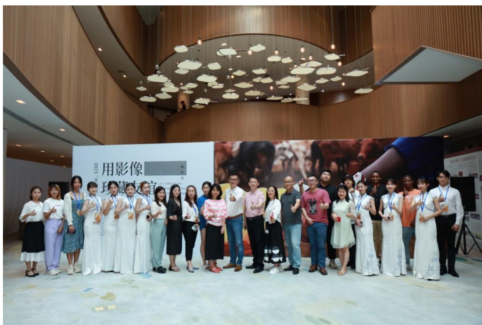
摄影展承办单位工作人员合影留念

省委外办一级巡视员罗军，广东公共外交协会常务副会长、广外国别和区域高等研究院非洲研究院院长傅朗，省政协外事侨务委员会专职副主任施志全，以及非洲驻穗总领馆官员等出席活动。