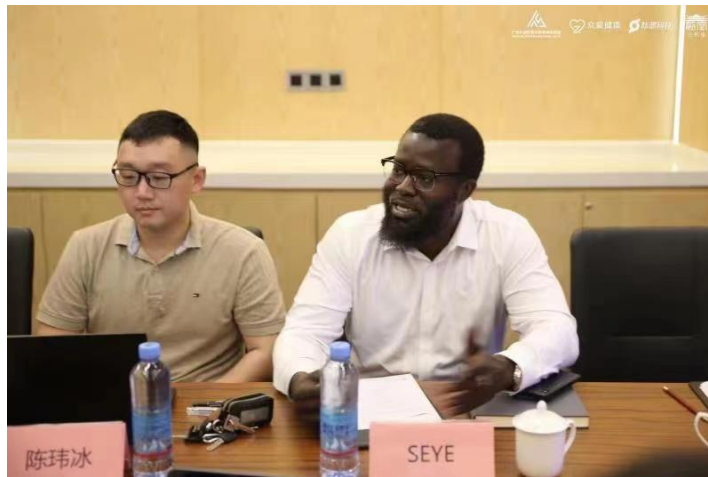
塞内加尔商会代表MEYE发表观点

商会及非洲研究院一道，共同探索每个非洲国家的定位，通过对各个国家比较优势的深度挖掘，选择合适的中国产业链进入非洲，这样便可以集中资源为不同的国家提供相对应的中国产品，使中非合作走深走实。